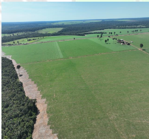
Imagem 11 setor oeste, identifica a zona industrial.

As imagens 09, 10 estão ao ponto norte da zona industrial que localiza o ponto P2 no mapa do zoneamento, e início da zona turística ZT2.