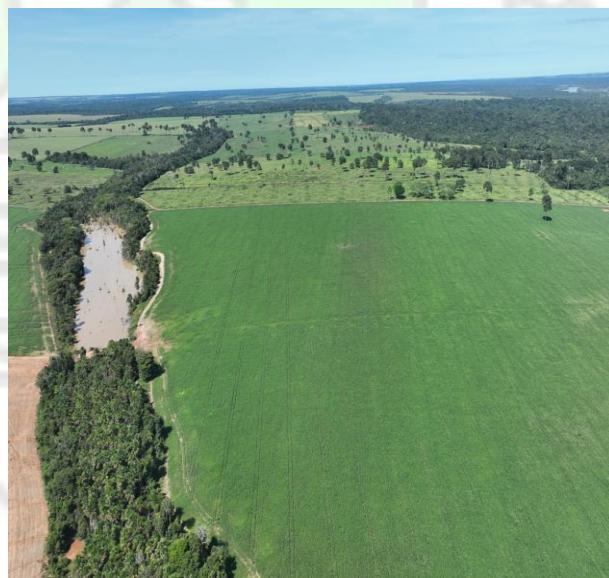
Imagem 12 no setor oeste, identifica a zona turística