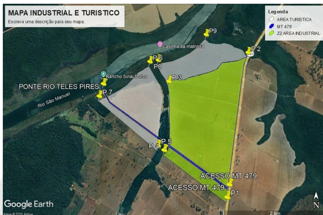
Mapa do zoneamento industrial e turístico nas margens da rodovia MT 479 E rodovia BR 163