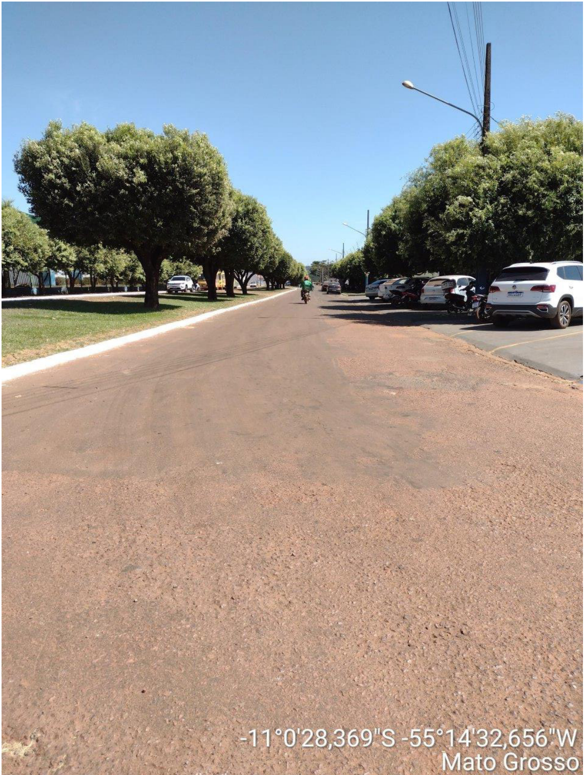
FINAL – LADO ESQUERDO