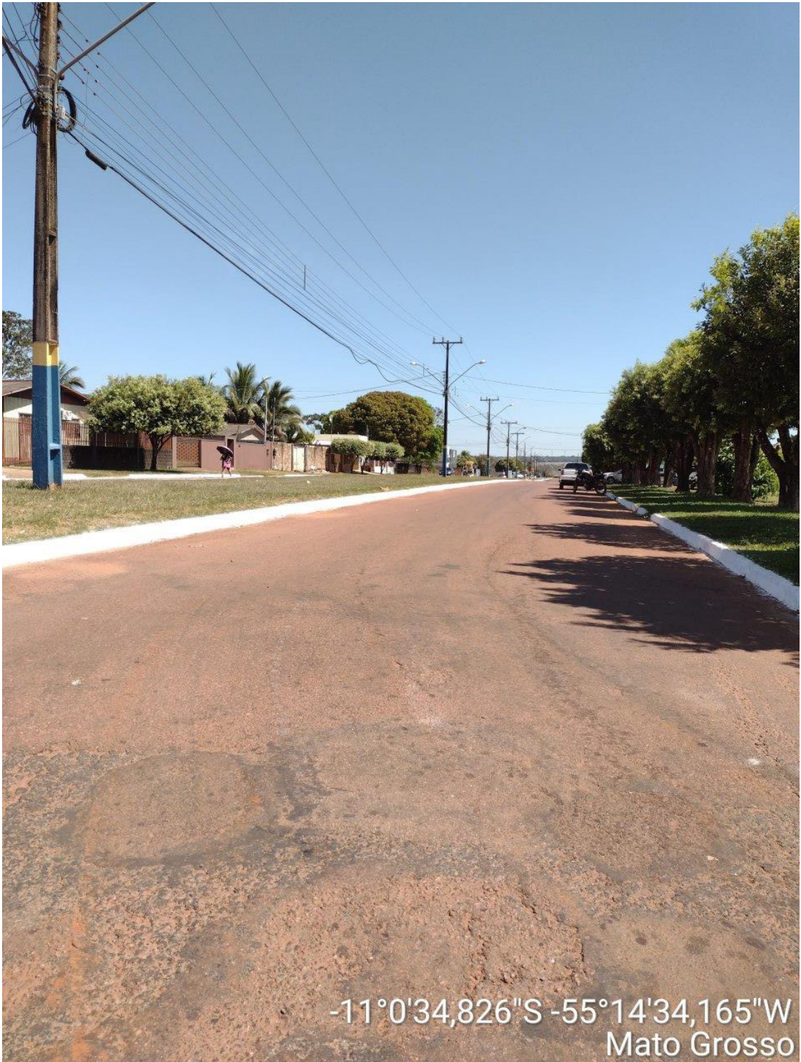
INICIO – LADO DIREITO