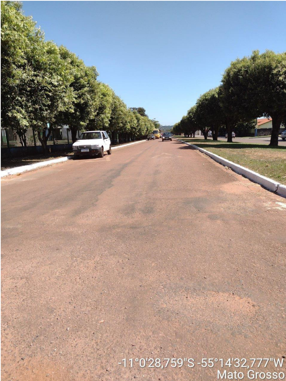
FINAL – LADO DIREITO