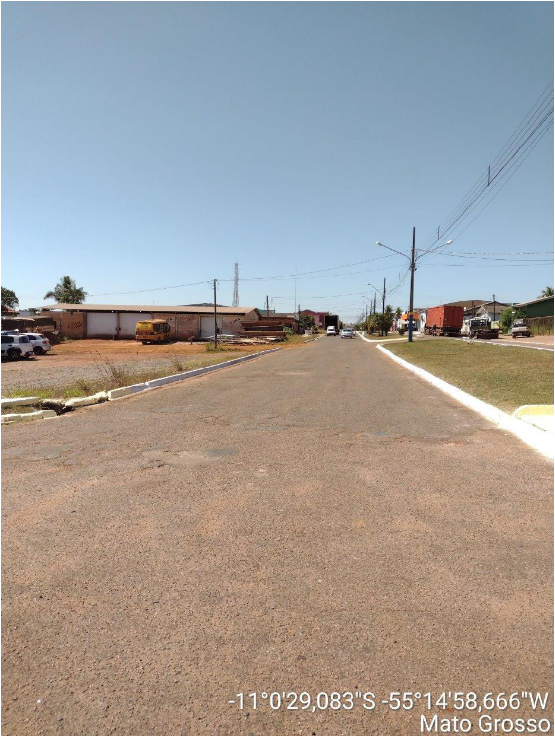
INICIO – LADO ESQUERDO