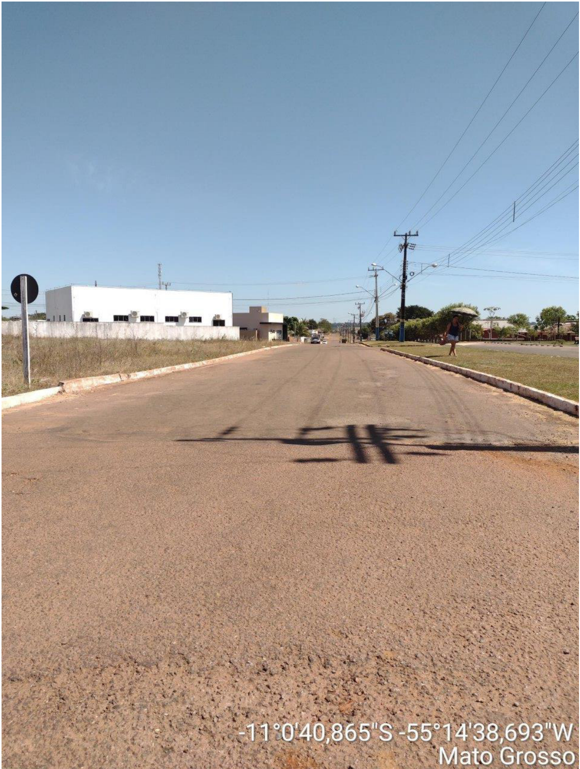
FINAL – LADO DIREITO